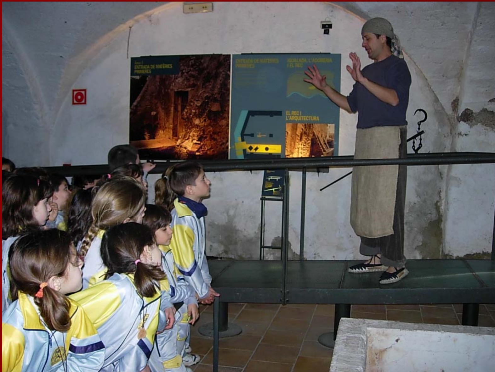
Visita escolar teatralitzada. El Xatet de Cal Granotes