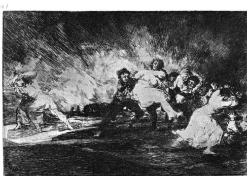
Espana entre las manos

Los Caprichos estan considerats com una obra mestra de l'art europeu, ja que s'avança estèticament al seus temps per l'expressivitat de les imatges i la temàtica. La tècnica emprada és una barreja de l'aiguafort i l'aguatinta , innovadora també fins el moment, amb la que aconsegueix els diferents nivells de contrastos foscos.